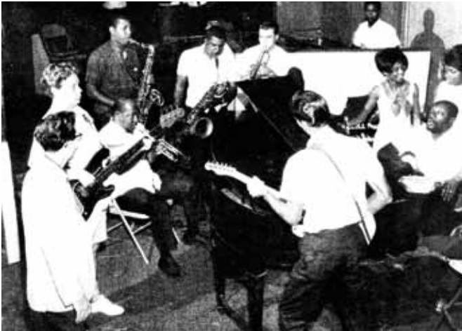
Opnamesessie in Stax Studio in de jaren '60

De grote Stax-ster was Otis Redding. Als hij introductie behoeft, begin dan bij The Definite Collection . Je kunt spreken van een Stax voor en na 1968. De dood van Redding (10