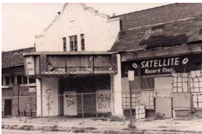
Vervallen Stax Studio in september 1989

december 1967) viel ongeveer samen met een breuk met het label Atlantic. Tegelijk nam de burgerrechtenbeweging een grimmiger karakter aan na de moord op Martin Luther King. Vóór 1968 was het gemengde Stax meer een speeltuin voor eigenzinnige artiesten dan erna, dat hoor je terug op de opnames.