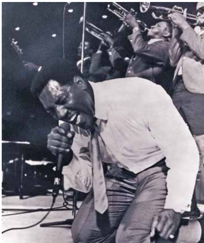
Otis Redding, 1967

bedoelde dat we ons tussen vrachtwagens moesten gedragen als vrachtwagens. Afdwingen die ruimte, je vege lijf in de strijd gooien. Als zo iemand oei zegt, bedoelt ze ook oei.