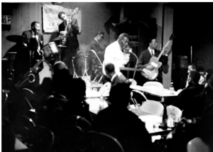
Howlin' Wolf, begin jaren '60

voor Sun zou worden. Maar de ruwste bluesbolster van de studio was Chester Arthur Burnett, beter bekend als Howlin' Wolf.